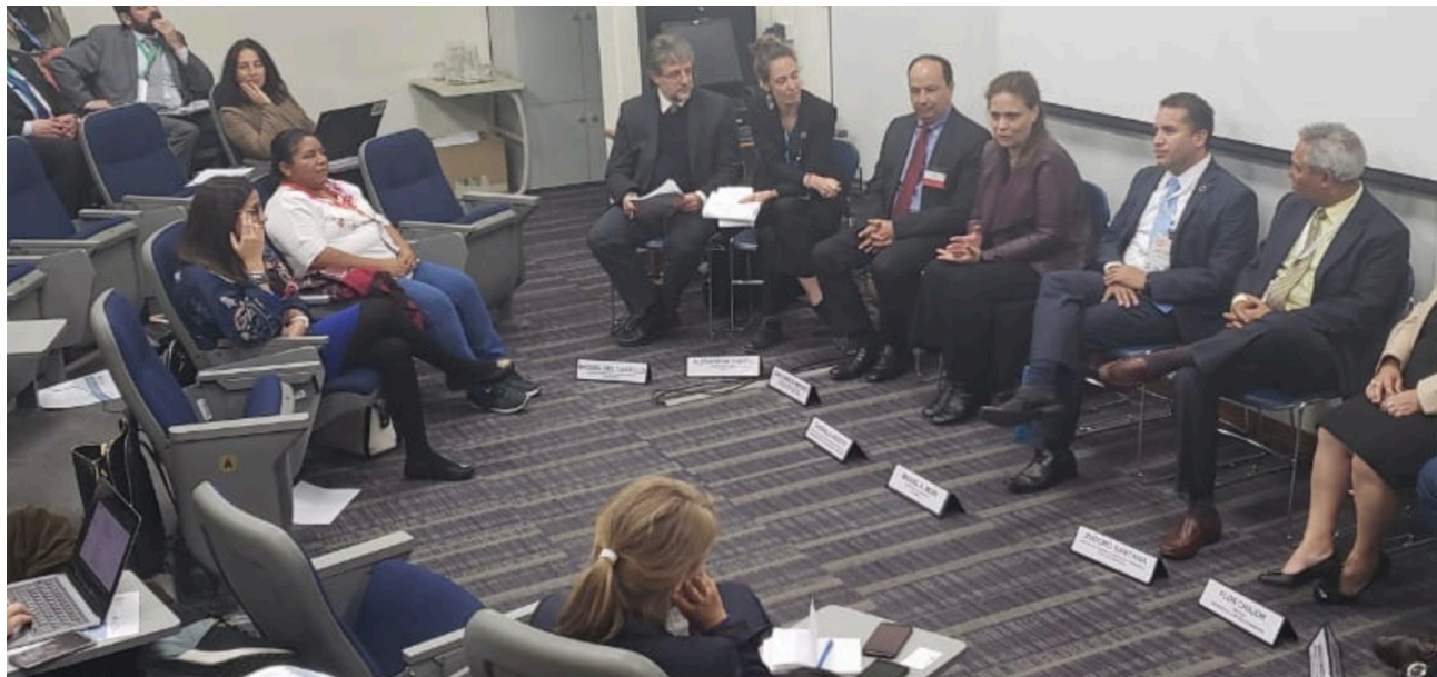
▲ : El Secretario de SEGEPLAN, Miguel Angel Moir, interviene en el diálogo sobre el desarrollo sostenible.

Líderes empresariales, ministros de gobierno y academia de Guatemala, Argentina, República Dominicana y CEPAL-México, participaron en el diálogo: “Juntos hacia una agenda transformadora: Creando la base para capitalizar los roles diferenciados de los actores de desarrollo” , y compartieron cómo cada uno está implementando las prioridades nacionales de los ODS y cómo los roles de cada uno deberán complementarse, según su área de influencia.