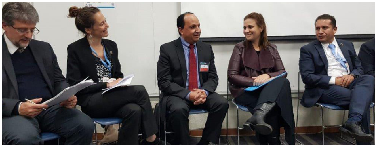
▲ En el diálogo participaron líderes empresariales, ministros de gobierno y académicos.