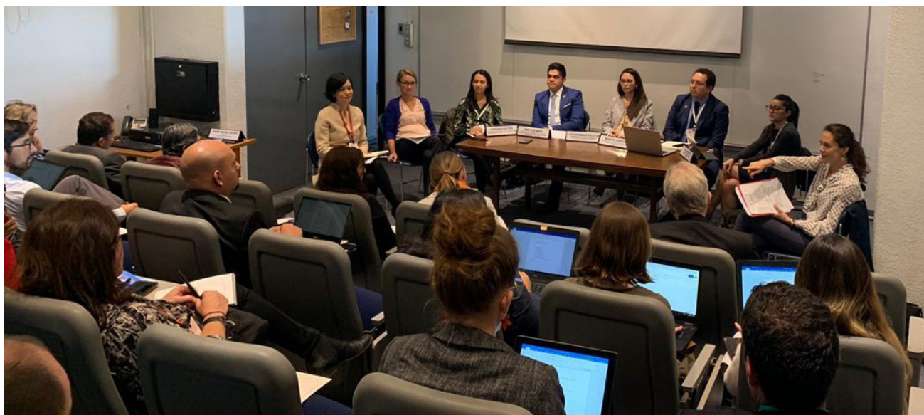
▲ Las Revisiones Nacionales han sido una experiencia enriquecedora para distintos países.

Para identificar los aportes de empresas y sociedad civil en la preparación del Informe de 2019, dijo que se ha buscado documentar los avances a