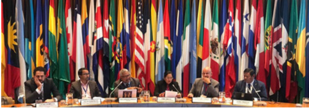
▲ La Presidenta del PARLACEN, Irma Amaya, tuvo a su cargo las conclusiones del encuentro.