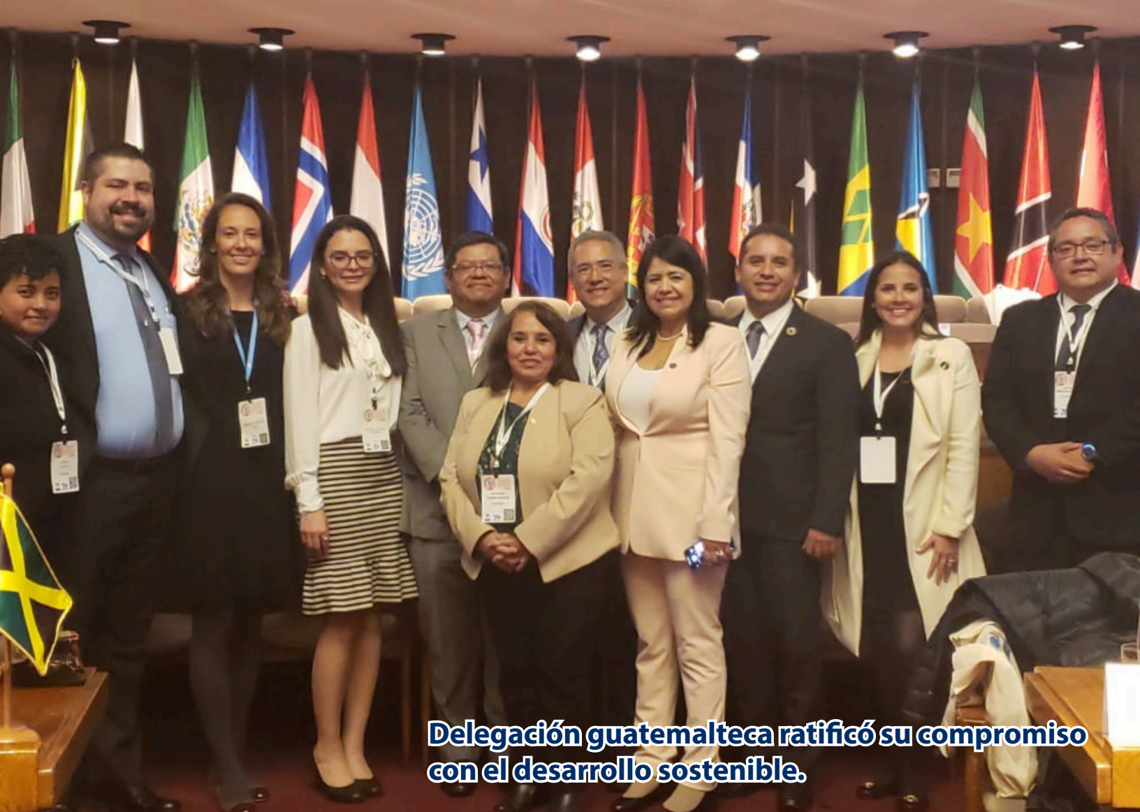
Delegación guatemalteca ratificó su compromiso con el desarrollo sostenible.